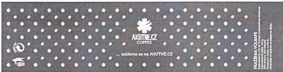
Příloha č. 2:

Nadační fond AKUTNĚ.CZ Kamenice 5 625 00 Brno č. ú.: 555000100/5500 RB www.akutne.cz