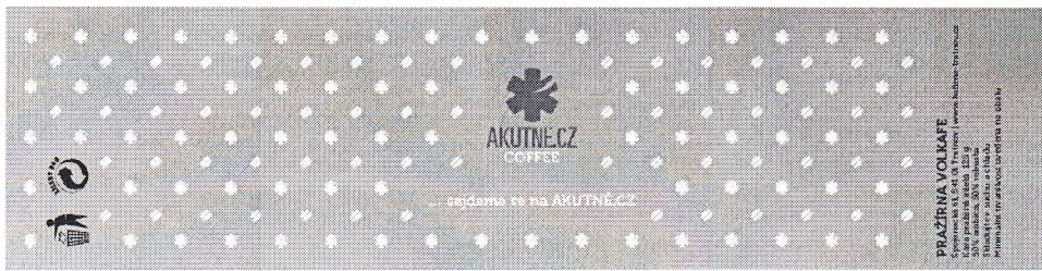
Příloha č. 1:

nadační fond výukového a publikačního portálu AKUTNĚ.CZ