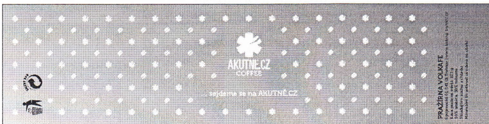
Příloha č. 4: