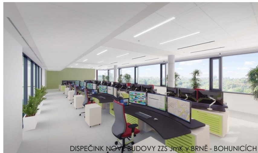
DISPEČINK NOVÉ BUDOVY ZZS JmK v BRNĚ - BOHUNICÍCH