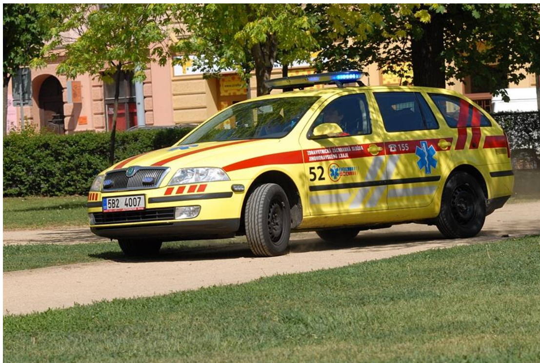
Příjezd RLP na místo události