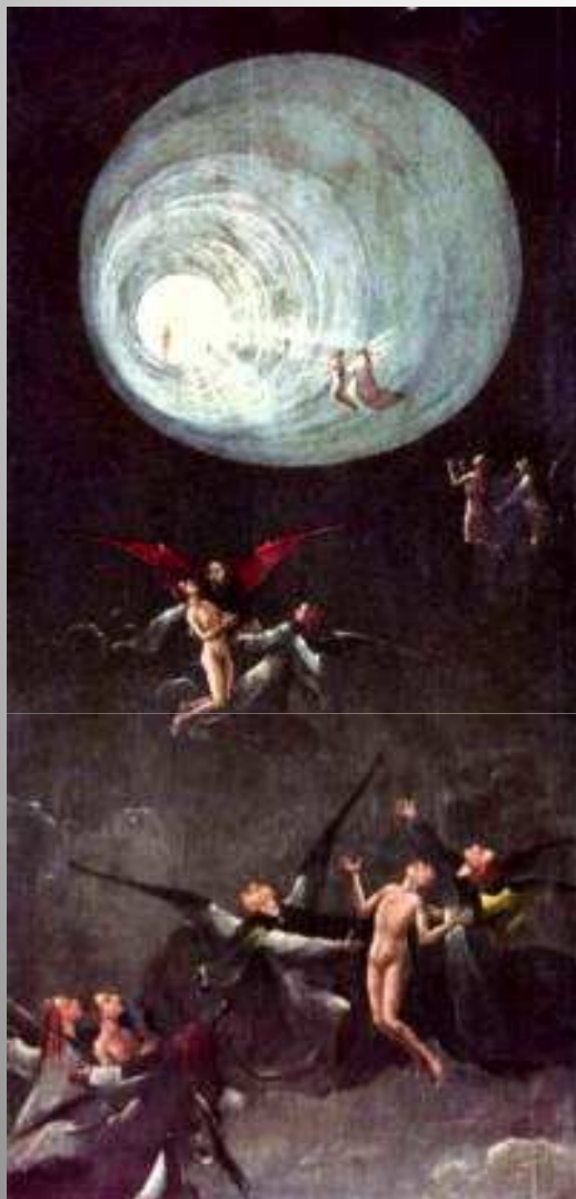
Hieronimus Bosch i současnost