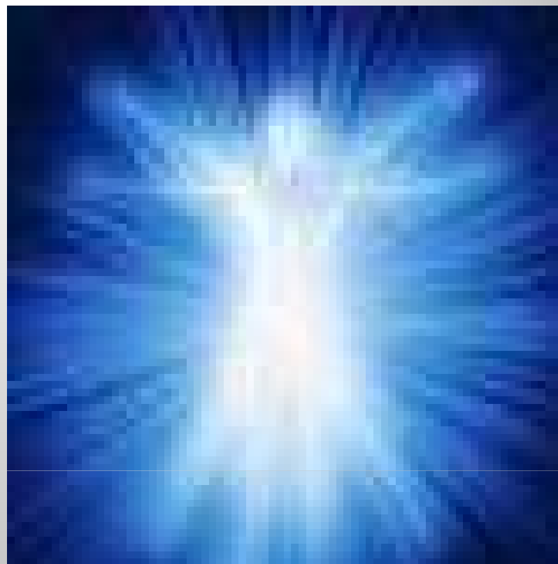
Transcendentální vize – NDE, OBE Near death experience Out of body experience