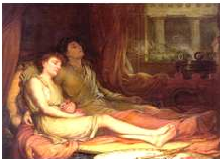
Spánek a smrt