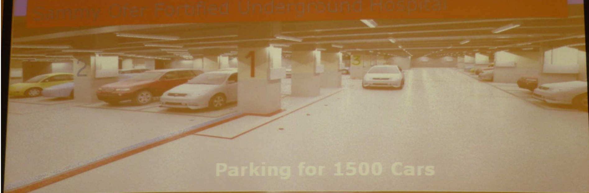
Parking for 1500 Cars