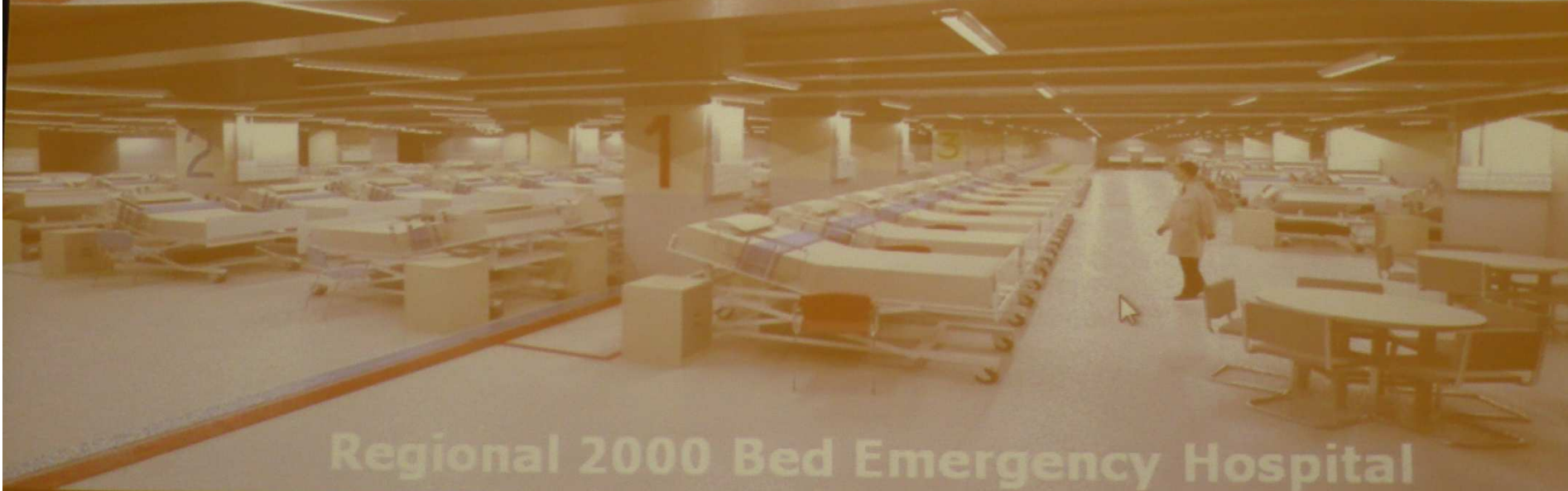
Regional 2000 Bed Emergency Hospital