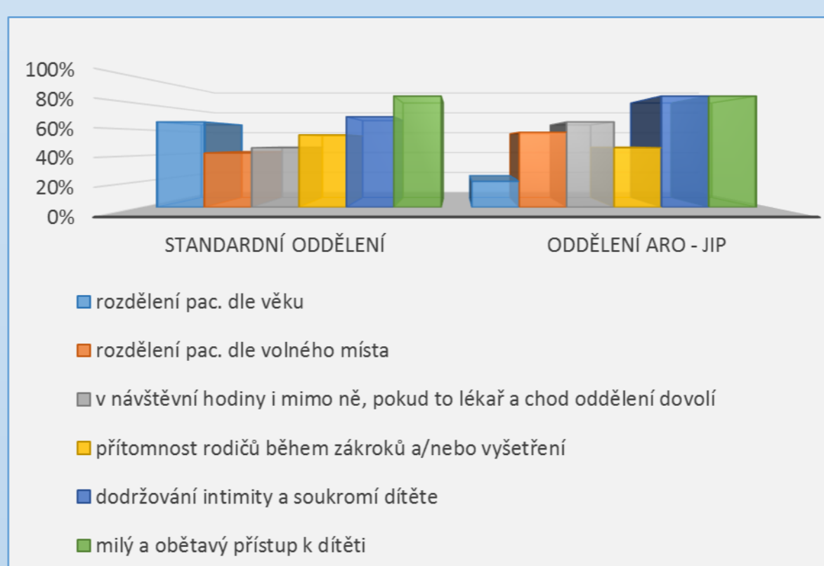
Graf č. 2: Ohrožení hospitalismem v nemocnici 8