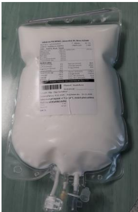
Obr. 1 AIO vak připravován v lékárně

Podávání vaků v domácím prostředí lze aplikovat mobilní parenterální pumpou a nebo infuzním setem s regulačním kolečkem. V současné době je v péči nutriční ambulance 65 pacientů s domácí parenterální výživou.