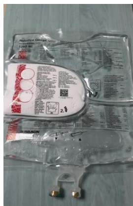
Obr. 2 Továrně připravovaná vak