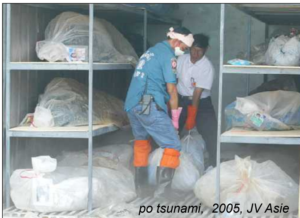
po tsunami, 2005, JV Asie