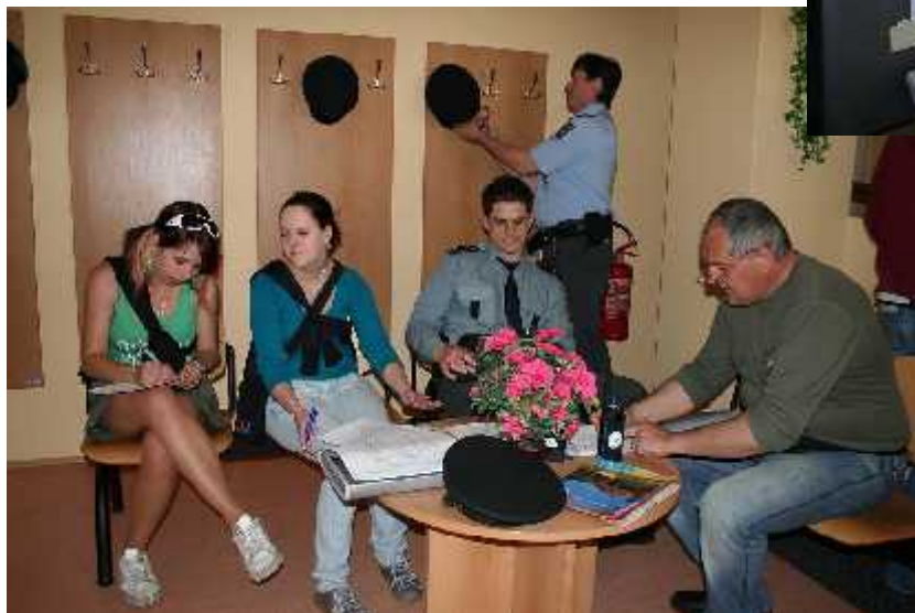
PČR - ztotožnění