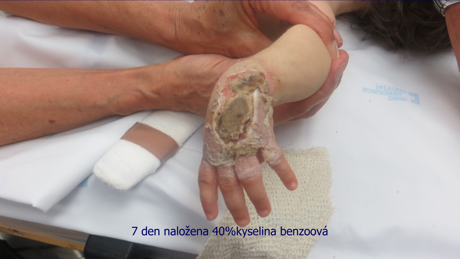
7 den naložena 40%kyselina benzoová