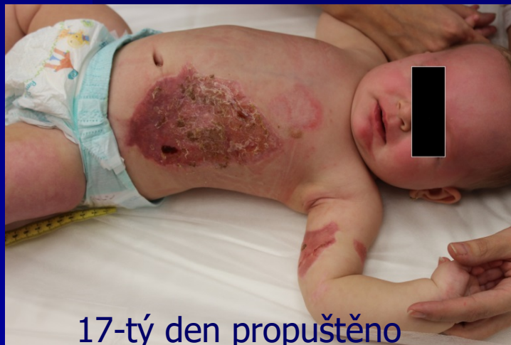
17-tý den propuštěno