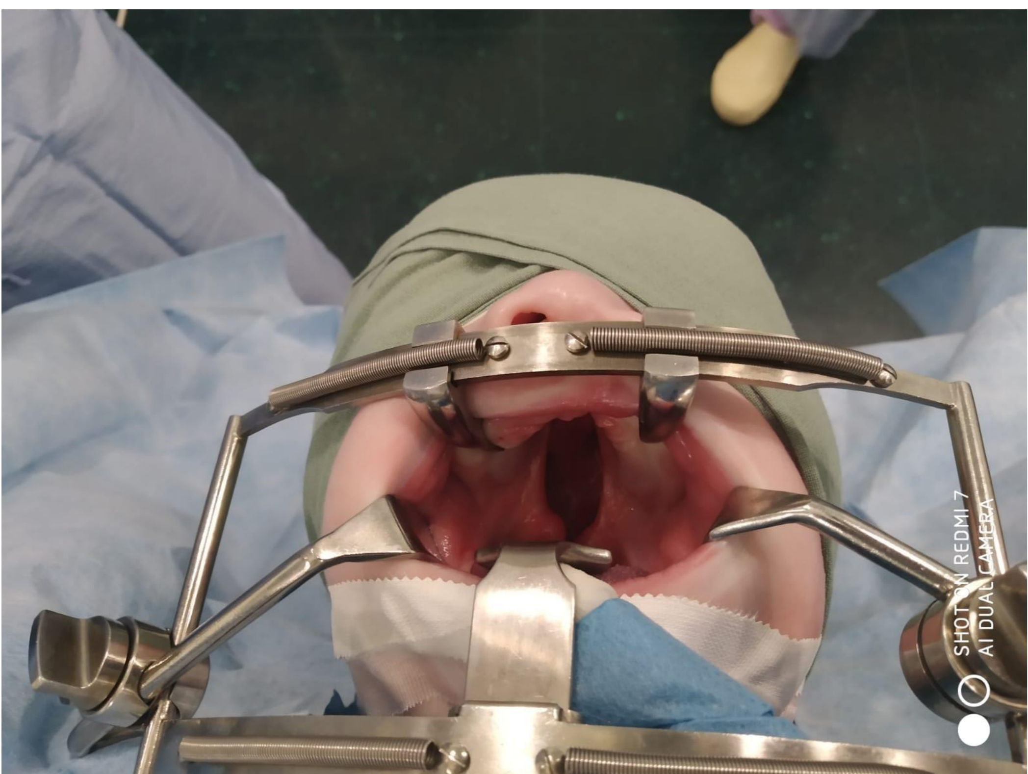
Obrázek 1: Rozštěp horního patra s nasazeným rozvěračem