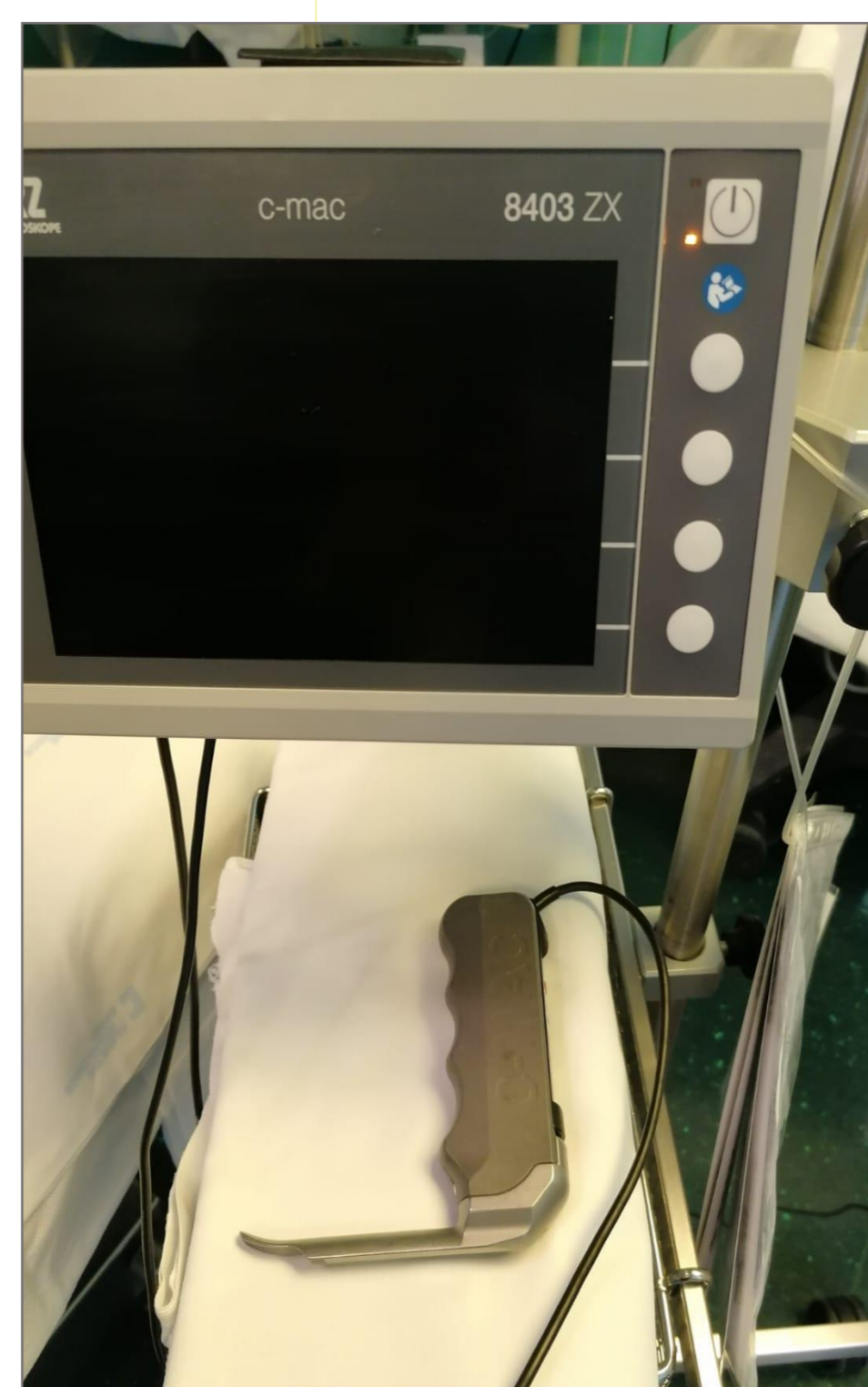
Obrázek 3: Videolaryngoskop