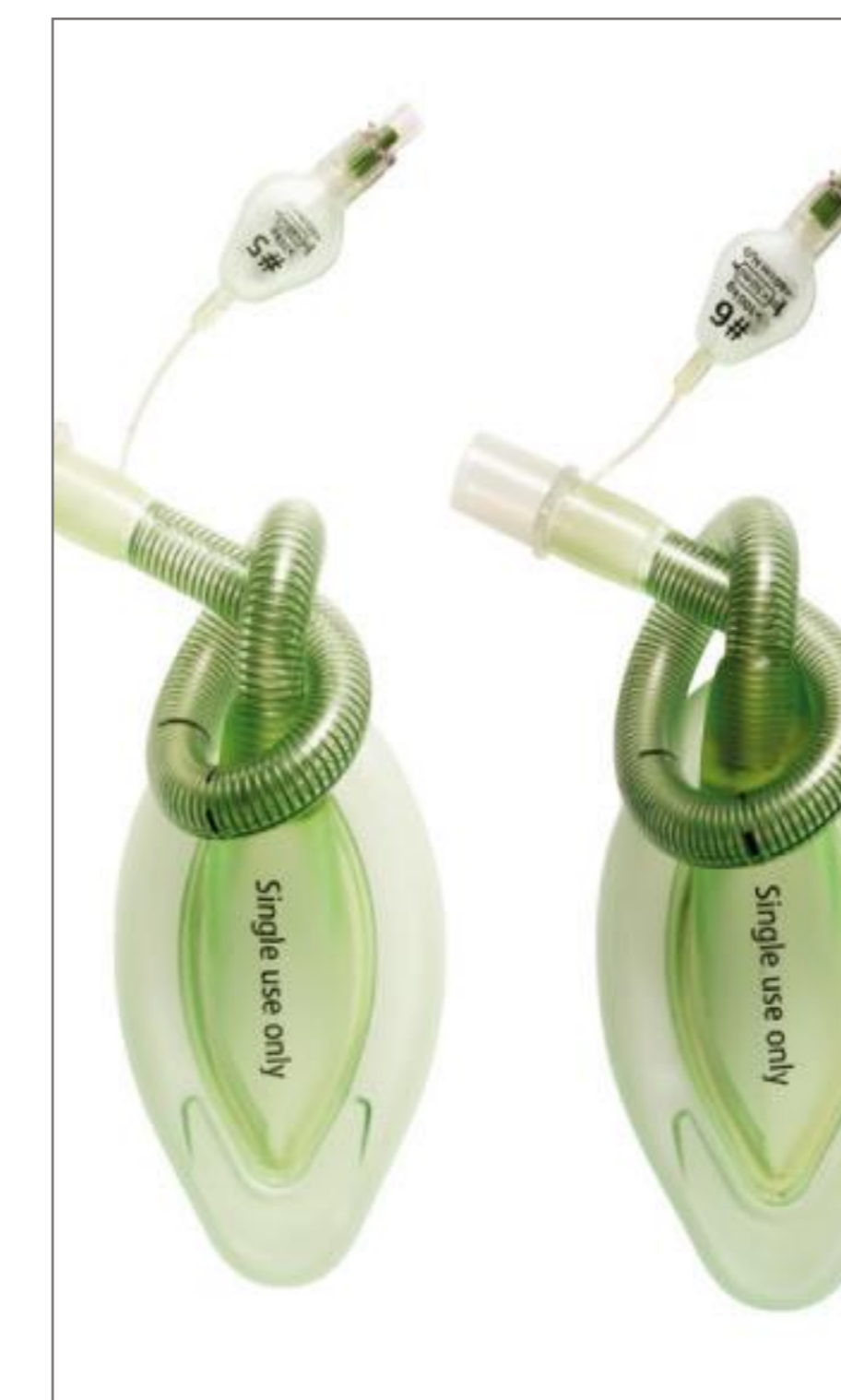
Obrázek 4: Laryngeální maska