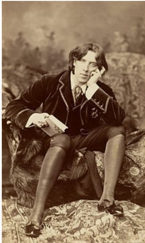
Oscar Wilde 1854-1900 irský spisovatel a básník

„Mladí muži chtějí být věrní, ale nejsou.